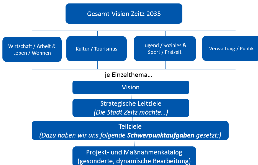
Abb. 5: Schematischer Aufbau des Leitbildes Zeitz – 2035, GMA 2019