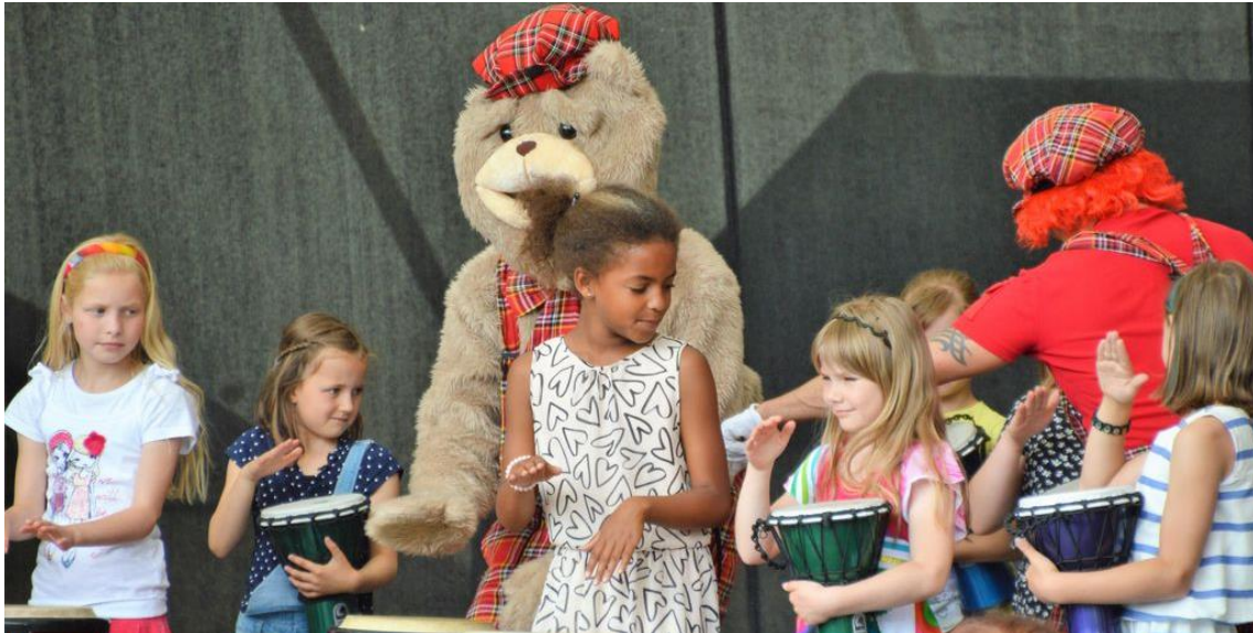
Abb. 10: Eckel, Reiner, Kinderfest im Schlosspark Moritzburg Zeitz, 2018

Die Stadt Zeitz verfügt über eine ausgewogene Schul- und KITA-Landschaft, ein Klinikum, Altenheime und vielfältige Beratungs- und Selbsthilfeangebote. Aufgrund des demografischen Wandels gewinnt die regionale Bindung junger Familien immer mehr an Bedeutung. Daher sollen attraktive Angebote für Kinder und Jugendliche erhalten und gefördert werden, um jungen Familien attraktive Wohn- und Lebensbedingungen zu bieten.