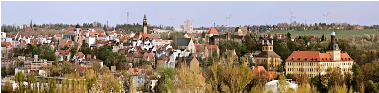
Abb. 1: Böttger, Carlo, Panorama Zeitz, 2008