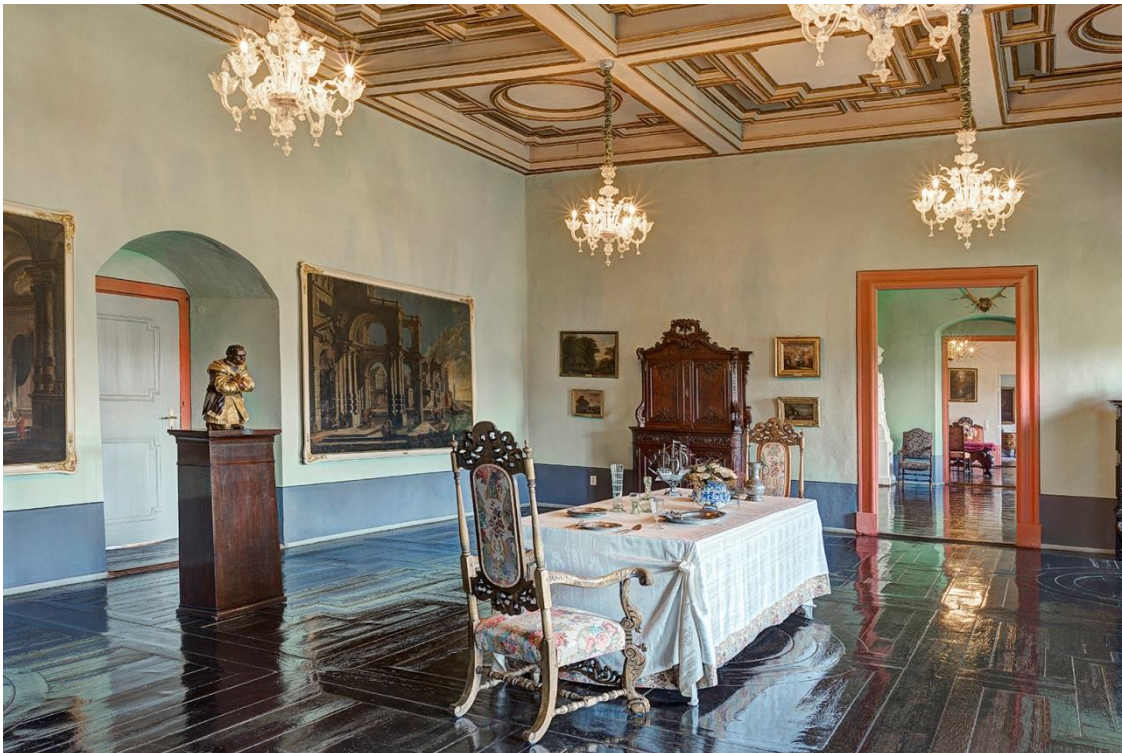
Abb. 8: Böttger, Carlo, Kleiner Festsaal im Schloss Moritzburg Zeitz, 2017

Die Dom- und Residenzstadt Zeitz feierte 2017 ihr 1050-jähriges Bestehen und kann auf eine reiche Geschichte zurückblicken. Ein Jahr nach der ersten urkundlichen Erwähnung der Stadt im Jahr 967 wurde Zeitz bis 1564 Bischofsresidenz. In der zweiten Hälfte des 17. Jahrhunderts wurde Zeitz für fast 60 Jahre Residenz des Herzogtums Sachsen-Zeitz. Mitte des 19. Jahrhunderts begann sich Zeitz zu einer Industriestadt zu entwickeln. In diesen prägenden Epochen entstanden die bedeutendsten und identitätsstiftenden Bauwerke. Neben dem im 17. Jahrhundert erbauten Schloss Moritzburg Zeitz mit angrenzendem Dom und Schlosspark bietet die Stadt eine Vielzahl von kulturhistorisch, industriegeschichtlich bzw. landschaftlich reizvollen Sehenswürdigkeiten.