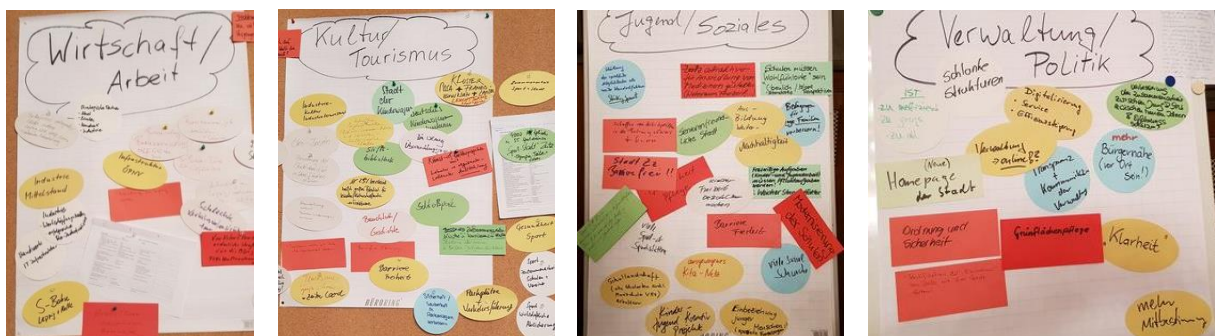
Abb. 3: Flipcharts der Auftaktveranstaltung vom 20.11.2018 im Friedensaal Zeitz