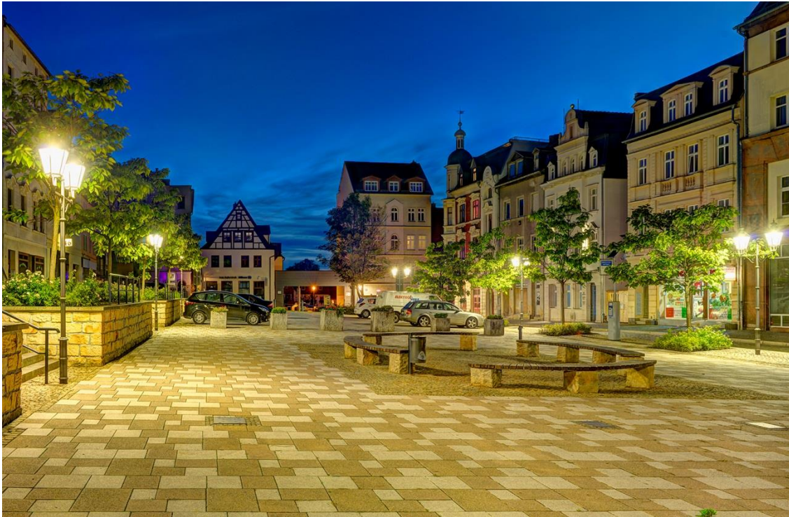
Abb. 7: Böttger, Carlo, Neumarkt Zeitz, 2017

Mit Beginn der Industrialisierung war Zeitz eine lebendige und wachsende Stadt. Jedoch sank seit den 1990er-Jahren aufgrund des Bevölkerungsrückgangs die Nachfrage nach verschiedenen städtischen Angeboten wie Wohnraum, Einzelhandel oder sozialer Infrastruktur. In Folge dessen kam es zum Leerstand in den Stadtteilen und in den Ortschaften. Im Rahmen des Stadtumbaus Ost wurden zahlreiche Wohnblöcke überwiegend in Zeitz Ost abgerissen. Viele gründerzeitliche Bauten, die vor der Wiedervereinigung stark vernachlässigt wurden, konnten nun nicht mehr erhalten werden. Noch heute sind diese Baulücken, Abrissflächen und Ruinen im Stadtbild sichtbar.