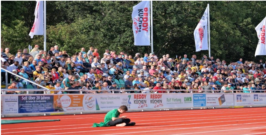
Abb. 11: Eckel, Reiner, Neueröffnung Stadion, 2019

In Zeitz sind ca. 14 Prozent der Bevölkerung mit über 4.000 Mitgliedern in 55 Sportvereinen aktiv. Zu den mitgliederstärksten Sportarten zählen u. a. Fußball, Gymnastik/Tanz, Kegeln, Volleyball und Kampfsport. Diese umfassen mehr als 50 Prozent des organisierten Sports. Die Vereinsmitglieder werden aufgrund des Einwohnerrückgangs sinken und es wird zu Nachwuchsproblemen kommen. 4