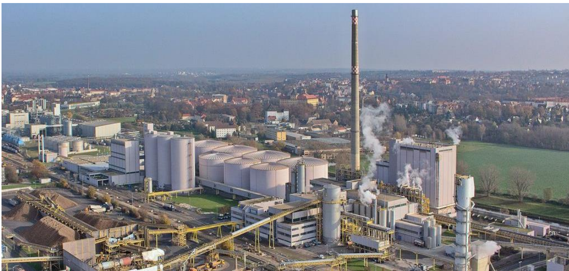
Abb. 6: Stadt Zeitz, Luftbild – Blick auf den Industriekomplex Südzucker und Stadt Zeitz, 2014

Seit dem 19. Jahrhundert entwickelte sich Zeitz zu einem innovativen Industriestandort. Es entstanden zahlreiche Fabriken, unter anderem für Klaviere, Maschinen und Kinderwagen. Diese prägten das Stadtbild bis ins 20. Jahrhundert hinein. In Folge der Auswirkungen der Deindustrialisierung ab den 1990er-Jahren sind die Zeitzer Zuckerfabrik, das Bergbauunternehmen MIBRAG und die Zeitzer Schokoladenfabrik Zetti als überregional bekannte Industriebetriebe erhalten. Zeitz ist heute hauptsächlich durch Handwerks- und Dienstleistungsbetriebe sowie Agrarunternehmen in den Ortschaften geprägt.