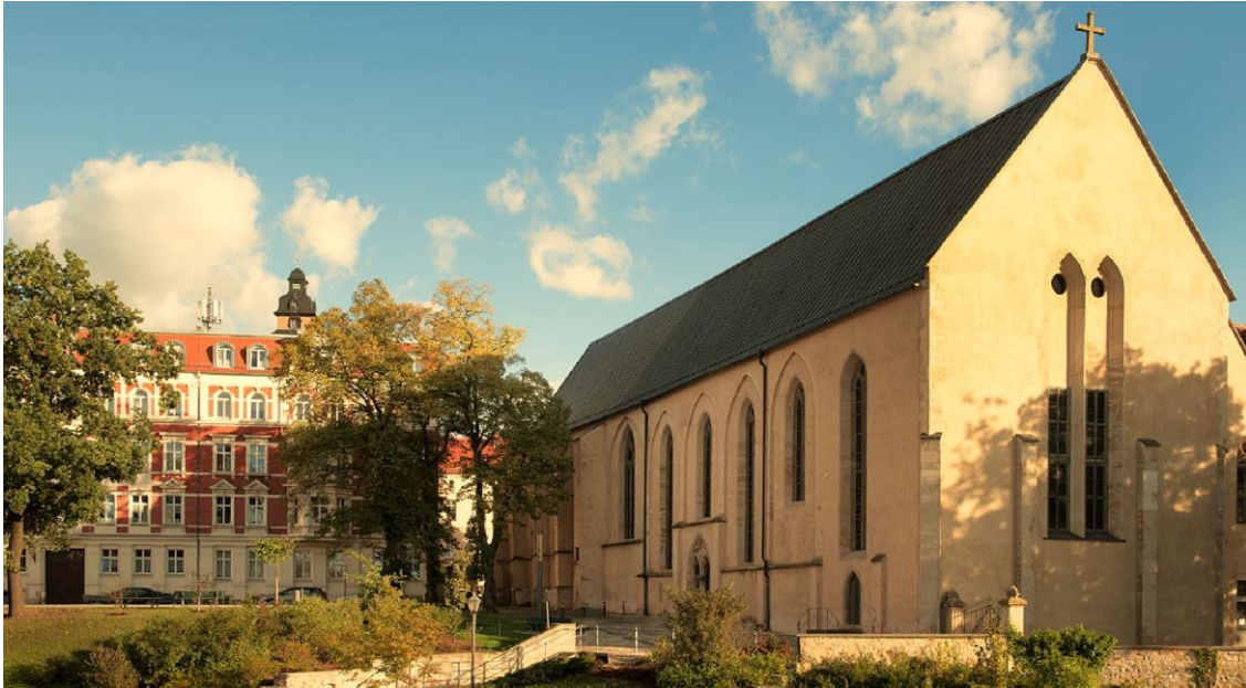
Abb. 9: Böttger, Carlo, Franziskanerkloster Zeitz, 2017

Neben den zahlreichen Sehenswürdigkeiten aus allen Epochen der Stadtgeschichte wie z. B. Schloss Moritzburg Zeitz mit dem Deutschen Kinderwagenmuseum, Dom St. Peter und Paul, Stiftsbibliothek, Franziskanerkloster, Unterirdisches Zeitz, Brikettfabrik Herrmannschacht und Kloster Posa können die Touristen die reizvolle Natur an der Weinroute der Weißen Elster erleben. Das kulturelle Leben wird durch zahlreiche Veranstaltungen u.a. Frühlings- und Herbstmarkt, Heinrich Schütz Musikfest, Zuckerfest und Lichterfest bereichert, die auch überregional Besucher und Touristen anziehen.