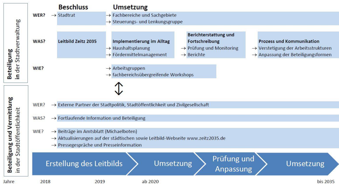
Abb. 14: Schematische Darstellung zur Leitbildfortschreibung

Über den Fortschritt und die Umsetzung des Leitbild-Prozesses ist die Stadtöffentlichkeit und Politik regelmäßig zu informieren. Dafür ist eine kommunale Steuerungs- und Lenkungsgruppe notwendig, um insbesondere neue Ideen in den einzelnen Arbeits- und Themenbereichen anzustoßen und die laufenden Maßnahmen und Projekte zu evaluieren. Im Abstand von zwei Jahren prüft die in der Verwaltung einzusetzende Steuerungs- bzw. Lenkungsgruppe die Umsetzung des Leitbilds und die Implementierung der Visionen, Leitziele, Maßnahmen und Projekte im Alltag. Das Ergebnis der Prüfung zur Entwicklung und Umsetzung des Leitbilds ist der Öffentlichkeit vorzustellen und dem Stadtrat erstmals bis zum 31.12.2021 vorzulegen.