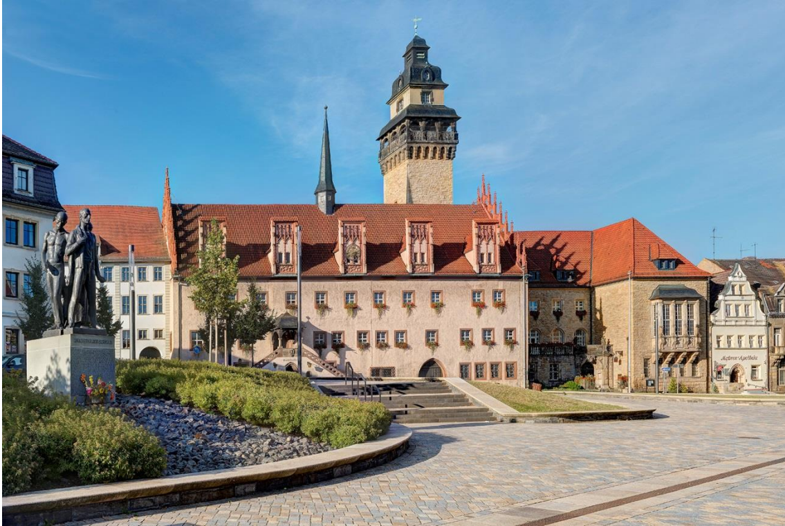
Abb. 13: Böttger, Carlo, Blick auf das Rathaus der Stadt Zeitz, 2017

In der Stadtverwaltung Zeitz waren 2018 insgesamt 423 Vollzeitbeschäftigte tätig, davon 261 Verwaltungsmitarbeiter, 158 Erzieher und vier Mitarbeiter in Altersteilzeit. 5 Zwei Drittel der Mitarbeiter der Stadtverwaltung sind älter als 45 Jahre. 6 Die Wahl des aktuellen Stadtrates erfolgte am 26. Mai 2019 und die konstituierende Sitzung des neuen Stadtparlaments fand am 3. Juli 2019 statt.